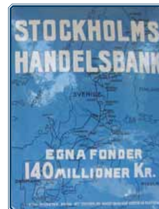
Reklamskylt från Stockholms Handelsbank från 1917.