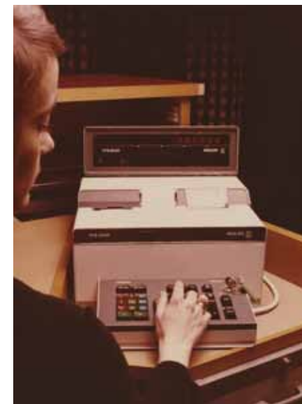
HTS (Handelsbankens TerminalSystem) infördes på bankens kontor 1973-75.

Men först i början av 1990-talet närmade sig banken relationen en terminal per kontorsanställd. I slutet av 1990-talet, då begreppet ADB-stöd fick ge vika för IT, kom HTD att kompletteras av persondatorer i nätverk.