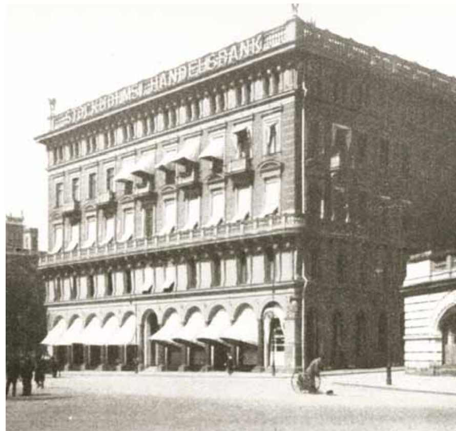
Sedan våren 1905 har Handelsbankens huvudkontor legat vid Kungsträdgårdsgatan i Stockholm.

Fraenkel tyckte det var olämpligt att banken var direkt ägare av bankkontor utanför Stockholm. I stället deltog banken aktivt i grundandet av nya lokala banker i vilka Stockholms Handelsbank hade nära samarbete och ägarintressen. Avdelningskontoret i Jönköping avvecklades och överläts 1895 till den nybildade Jönköpings Handelsbank. 1896 grundades Skånska Handelsbanken och året därpå Göteborgs Handelsbank. Med dessa, liksom med Sundsvalls Handelsbank,