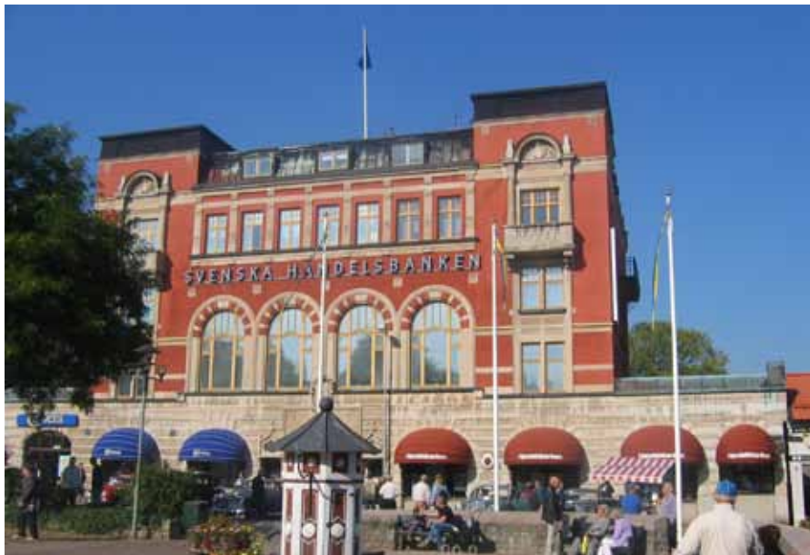
I Oscarshamn har Handelsbanken drivit verksamhet sedan 1919, då kontoret förvärvades från Bankaktiebolaget Södra Sverige.

1900-talets första decennier kan i såväl Sverige som i övriga Europa betecknas som banksammanslagningarnas tid. I Sverige mer än halverades antalet banker.