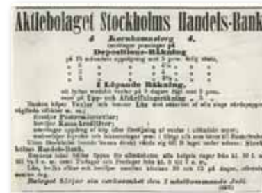
Handelsbankens första annons från den 29 juni 1871.

ägna sig åt "den egentliga bankverksamheten" med in- och utlåning och koncentrera sig på den lokala bankmarknaden, d v s huvudstadens näringsliv.