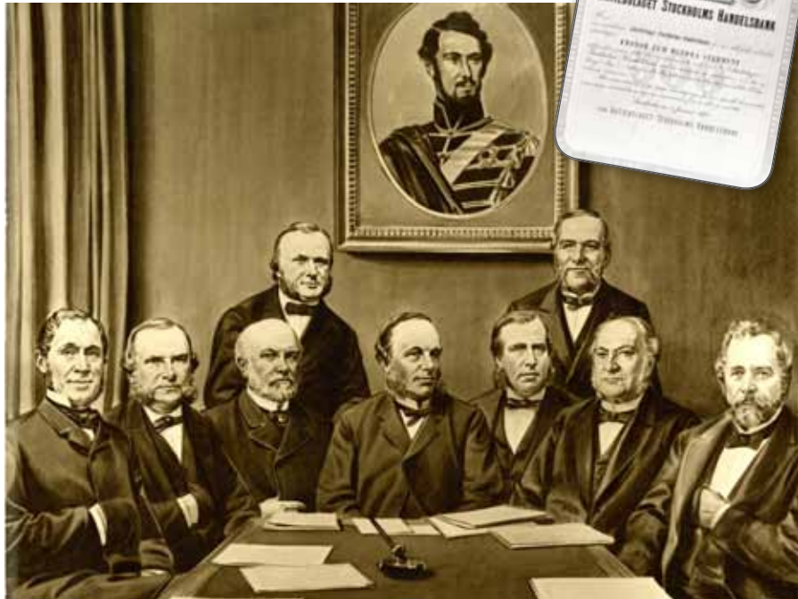
Ledamöterna i Stockholms Handelsbanks första styrelse.

Handelsbankens historia går tillbaka till våren 1871 då ett antal framträdande företag och personer inom Stockholms näringsliv grundade Stockholms Handelsbank. Bakgrunden var en personkonflikt inom Stockholms Enskilda Bank som nådde sin kulmen i april 1871 då åtta styrelseledamöter avgick och kort därefter beslöt att bilda en ny bank. Då Handelsbankens första styrelse till stor del kom att utgöras av tidigare medlemmar av direktionen för Enskilda Banken kom den nya banken länge i folkmun att kallas "Frånskilda Banken".