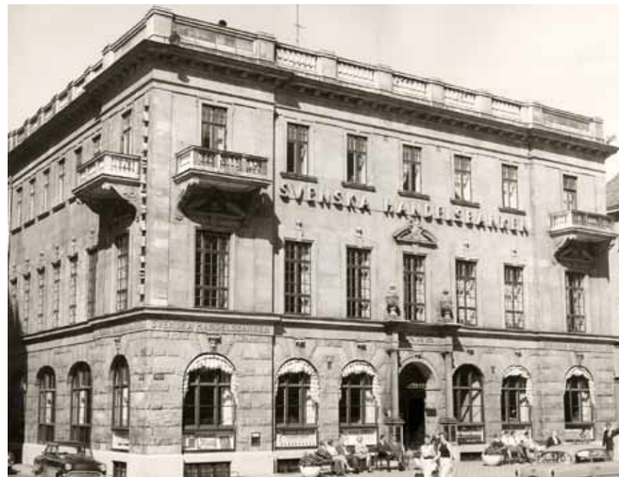
Handelsbankens kontor vid Stortorget i Helsingborg på 1950-talet. Huset, som tidigare var säte för Bankaktiebolaget Södra Sverige, övertogs av Handelsbanken 1919.

Under mellankrigstiden fortsatte konsolideringen på den svenska bankmarknaden. Handelsbanken kunde, bl a till följd av förvärv av t ex Mälarebanken 1926, i stort bibehålla antalet kontor på en stabil nivå om drygt 260. Samtidigt drog övriga affärsbanker drastiskt ned på antalet kontor.