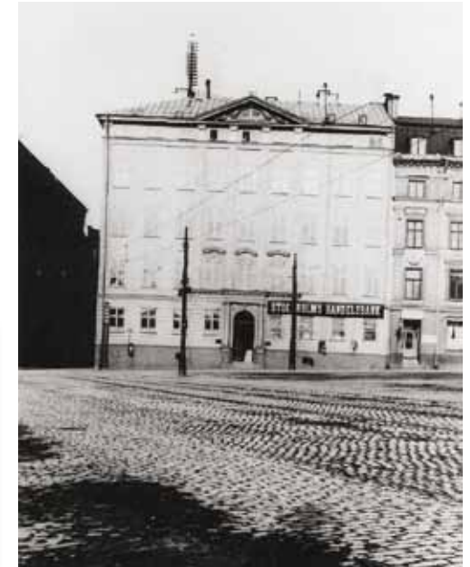
Stockholms Handelsbanks första kontor vid Kornhamnstorg, Gamla Stan.

Banken erhöll sin första oktroj, det vill säga tillstånd att driva bank, av Kungl. Maj:t den 12 maj och den 1 juli 1871 öppnade bankens verksamhet i hyrda lokaler vid Kornhamnstorg i Gamla stan, som då ännu var Stockholms kommersiella och finansiella centrum. Antalet medarbetare, inklusive VD, uppgick till 12 personer. Under bankens första år var hela verksamheten, inklusive expeditionsiokalen, samlad till lokalerna en trappa upp i Schinkelska huset med adress Kornhamnstorg 4. Några år senare öppnades de första avdelningskontoren i Stockholm: 1876 på Södermalm (Götgatan 16), 1878 på Normalm (Fredsgatan 32) och