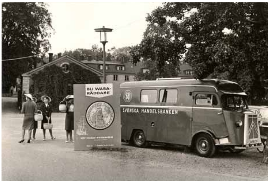
Handelsbanken bidrog ekonomiskt till att regalskeppet Wasa, som sjönk 1628, kunde bärgas 1961. Här har Handelsbankens bankbuss parkerat i närheten av bärgningsplatsen.

Handelsbanken övertog 1971 generalagenturen för försäljning av de så kallade Koncentrafonderna från Åhlén & Holm AB. Detta blev grunden till Handelsbanken Fonder.